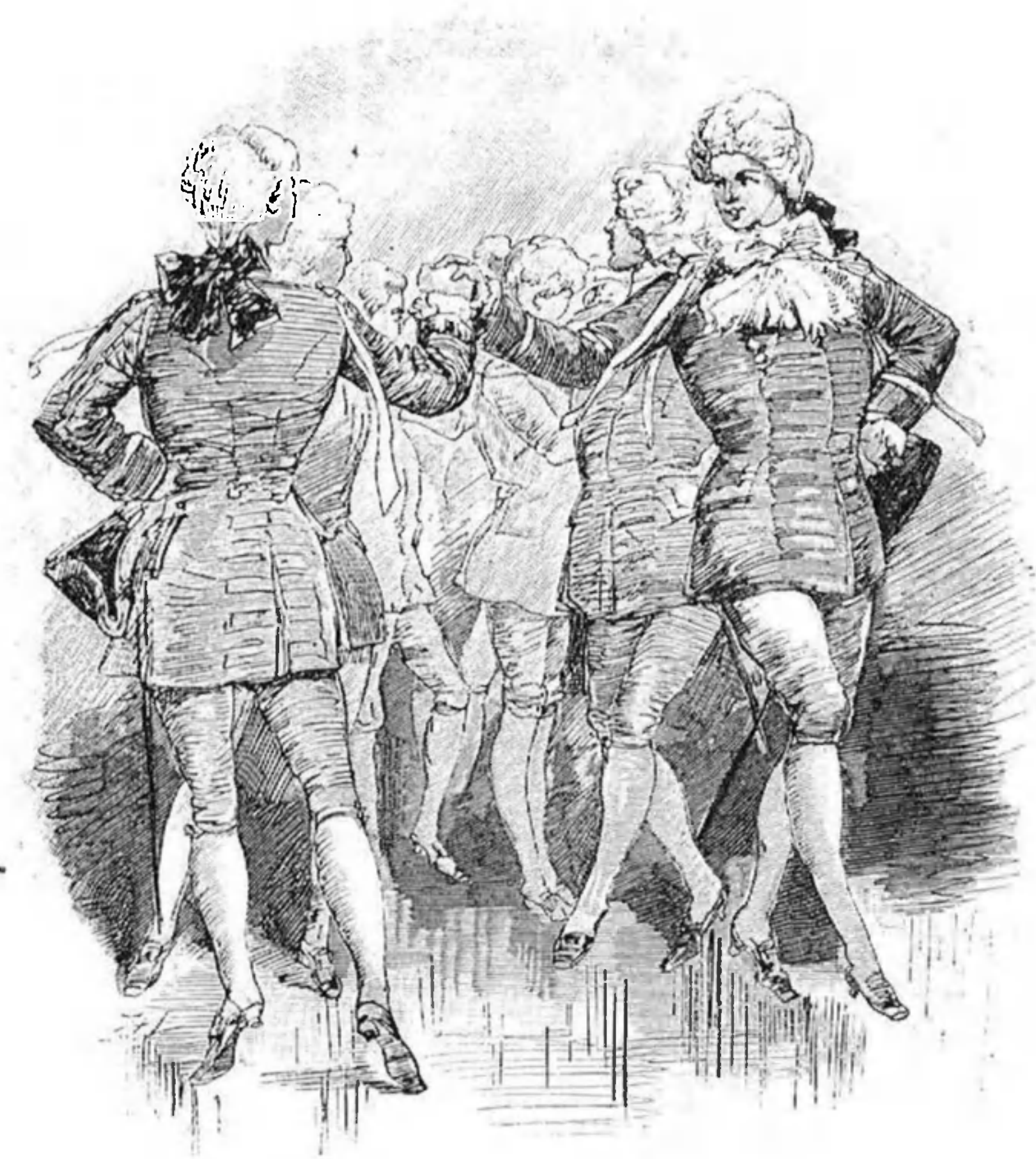
Tyske kadetter danser Menuet ca. 1890